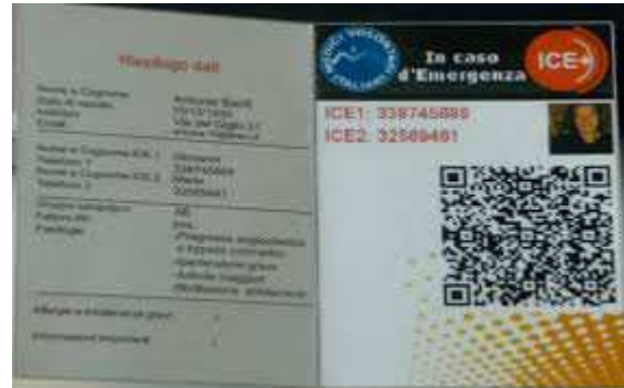
Carta d'identità salvavita